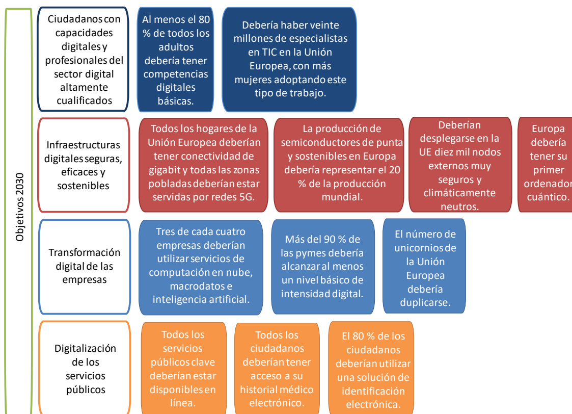
Figura 2. La Brújula Digital de Europa

Por su parte, el Plan de Acción de Educación Digital (2021-2027) plantea la visión que tiene la Comisión Europea de una educación digital de alta calidad, inclusiva y accesible en Europa. Es un llamamiento en favor de una mayor cooperación a escala europea para aprender de la crisis de la COVID-19, durante la cual se está utilizando la tecnología a una escala sin precedentes para fines de educación y formación y para adecuar los sistemas de educación y formación a la era digital. En concreto, tiene dos prioridades estratégicas: 1.- fomentar el desarrollo de un ecosistema educativo digital de alto rendimiento, y 2.- perfeccionar competencias y capacidades digitales para la transformación digital.