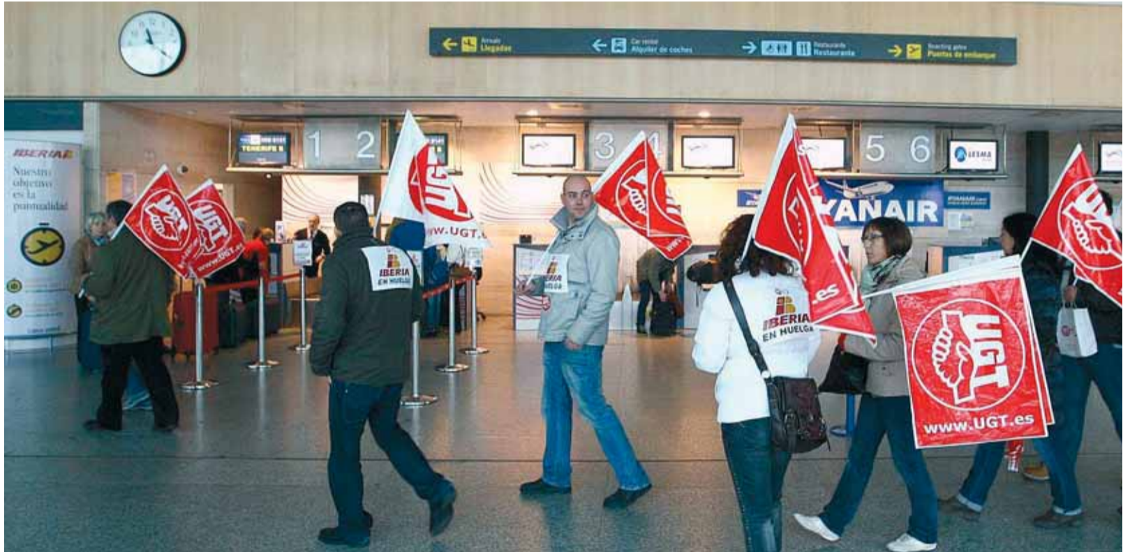
El plan de desmantelamiento de la aerolínea tiene como objetivo convertir a Iberia en una filial subsidiaria de British Airways.

Este plan de desmantelamiento, organizado desde IAG y ejecutado por la Dirección de Iberia, contando con la complicidad de todo el consejo de administración de la aerolínea española, entre los que se encuentran representantes del Estado español a través de la SEPI y de la nacionalizada Bankia, tiene como objetivo