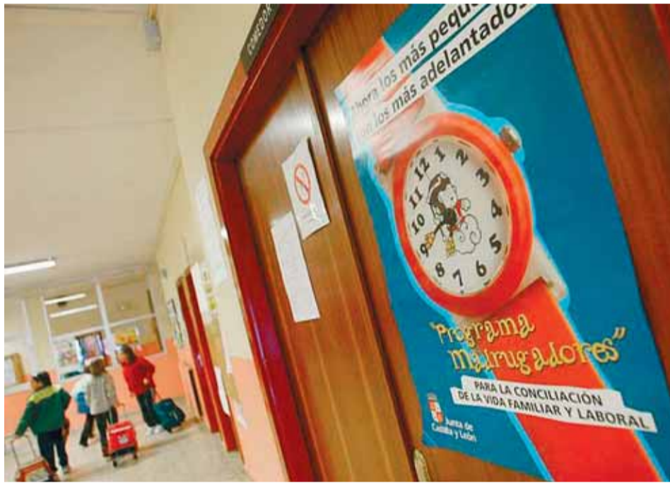
Un colegio con programa de Madrugadores.

Desde UGT Castilla y León ya se anunció que la introducción del pago en 2012 supondría una merma de ingresos; la expulsión del servicio de las familias que, debido al incremento del desempleo, no pueden acceder a dichos programas de conciliación; así como un ataque a la educación pública ya que se encontrará con la competencia a la baja de la educación privada o concertada, cuyos empleados tienen peores situaciones laborales. El Sindicato no encontrará lo-