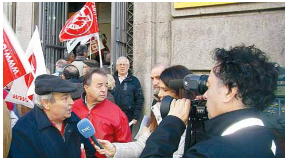
Un grupo de ciudadanos, durante la manifestación.

Los Jubilados y Pensionistas de UGT continúan, por otra parte, movilizándose contra los recortes del Gobierno y los efectos que estas medidas están provocando en este colectivo.