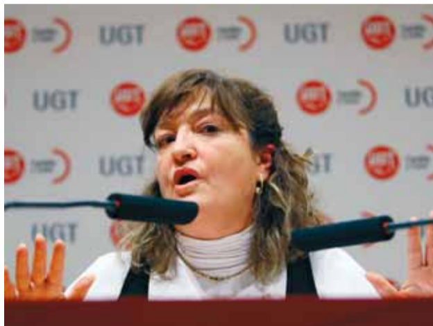
UGT exige un compromiso con la Sanidad Pública.