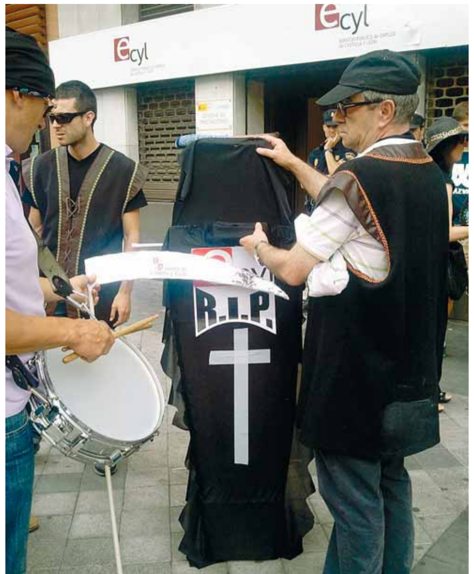
Una de las protestas llevadas a cabo por los Empleados Públicos.

Responsables de la Federación, que creen que existen recursos propios suficientes para garantizar la totalidad de los puestos de trabajo, han recordado que las políticas activas de empleo son competencia de la Junta de Castilla y León, a través de su Consejería de Economía y Empleo, y que su deber es el de dotar a las oficinas de personal propio suficiente para dar un servicio de calidad, máxime en momentos en los que el desempleo está alcanzando cotas hasta ahora desconocidas.