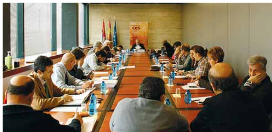
Los miembros del CES defienden que la modificación reduce las funciones de la institución.